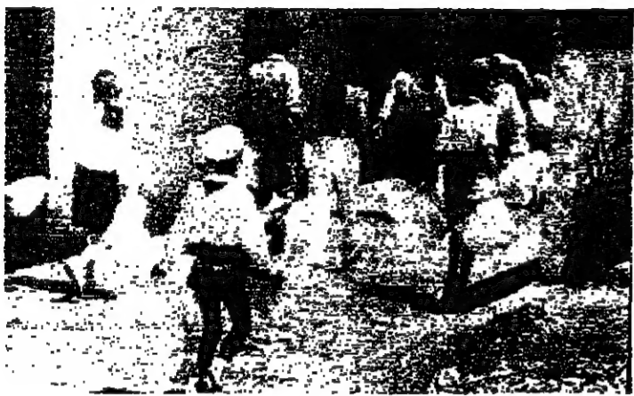
يحاولون تجنب التلوثات الى حيثما يمكن ان تلقى